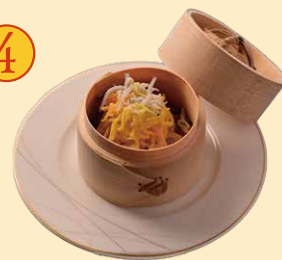
烏賊としらすの 飾り焼売